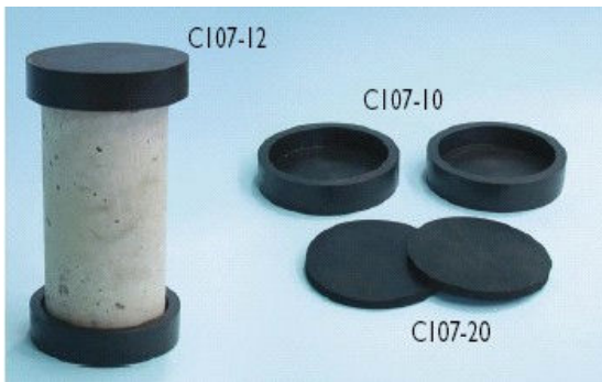
C107-10 Проставки для проведения испытаний цилиндров 150x320 мм.